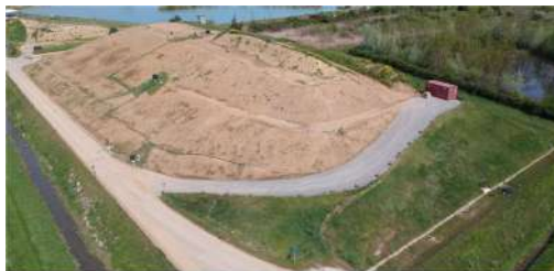
Figura 3: Foto aerea Discarica 2 - lato Sud.

Descrizione Realizzazione di una nuova vasca per circa 400'000 mc di rifiuti e relativo capping.