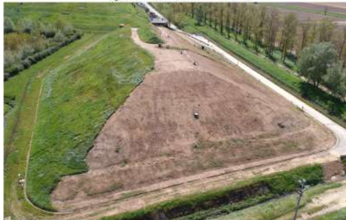
Figura 4: Foto aerea Discarica 2 - lato Nord.